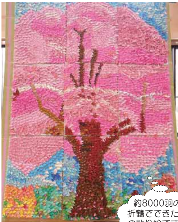
約8000羽の 折鶴でできた桜 の貼り絵です！