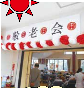
鴻江理事長から90歳以上の方ひとりひとりへ色紙が手渡されました☆