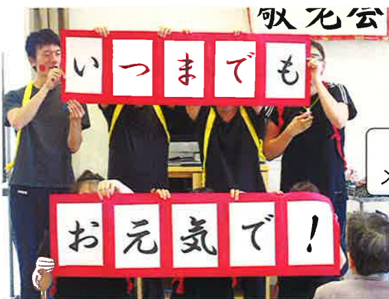
職員からのメッセージです