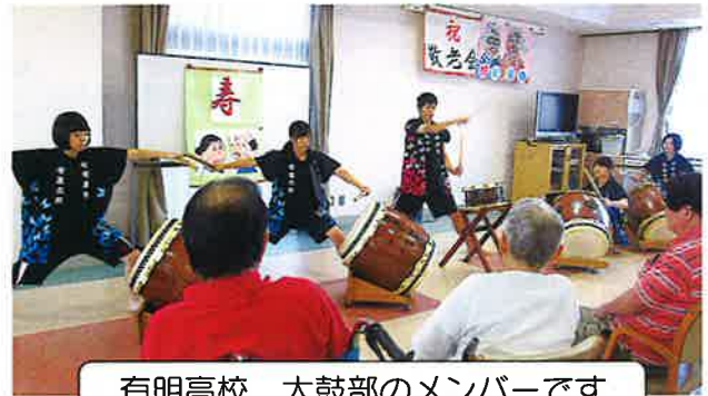
有明高校 太鼓部のメンバーです