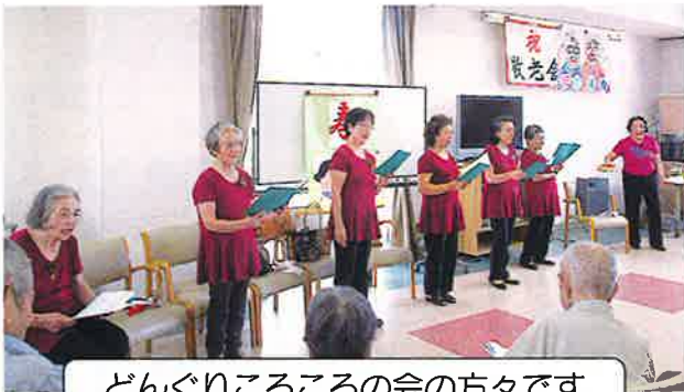
どんぐりころころの会の方々です

18日(金)には、どんぐりころころの会、19日(火)には有明高校太鼓部の方々にそれぞれボランティアで来て頂きました。参加された利用者の方々は真剣に視聴され、なかには感動され涙を流された方もおられました。90歳以上の利用者様を表彰する「寿表彰」や、一年間休まず利用された利用者様への「皆勤賞」の表彰を行いました。表彰の後、敬老会ではすっかりお馴染みになったスタッフの出し物「花笠音頭」に利用者様の手拍子や掛け声が大きくホールに鳴り響き、盛会のうちに敬老会を終えることができました。感動の2日間でした。