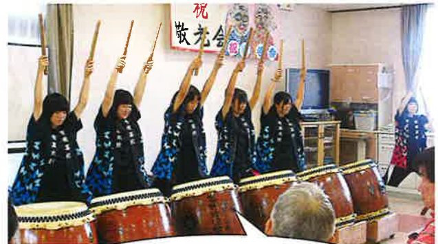
豪快で勇壮な和太鼓と高校生の華麗な躍動に、皆様感動されていました。