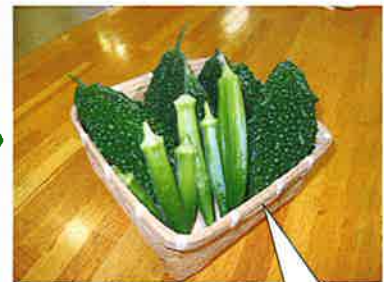
グリーンカーテンから 収穫したゴーヤです。