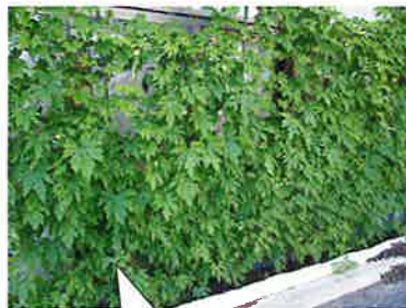
グリーンカーテン 完成です。

前回のさくら通信でゴーヤを植えた事をお伝えしました。 夏にはグリーンカーテンが完成しました!!