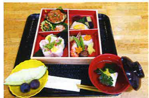
超豪華な敬老会特製弁当です