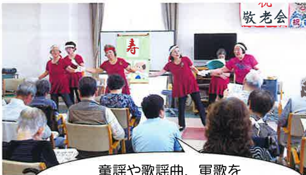
童謡や歌謡曲、軍歌を利用者様と一緒に歌いました。