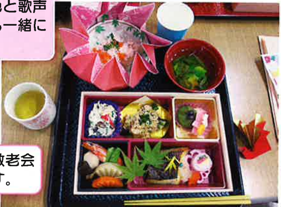
昼食は豪華な敬老会 特製弁当です。