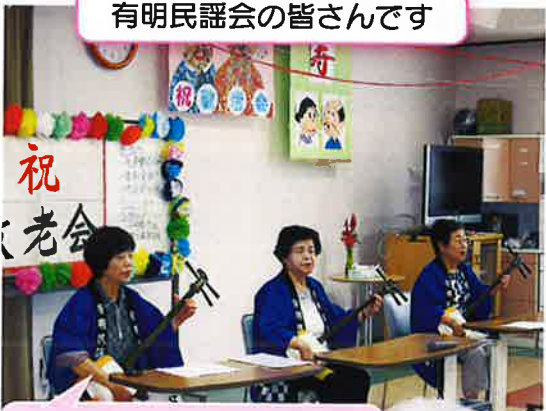
有明民謡会の皆さんです