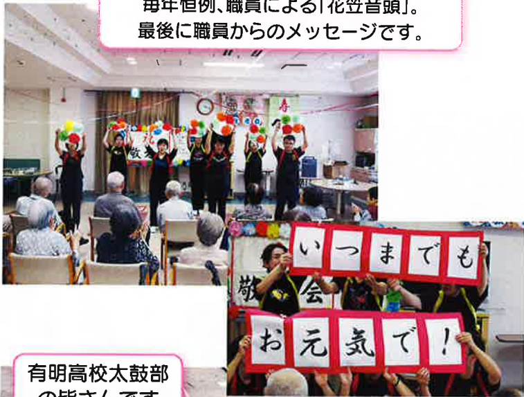
毎年恒例、職員による「花笠音頭」。 最後に職員からのメッセージです。