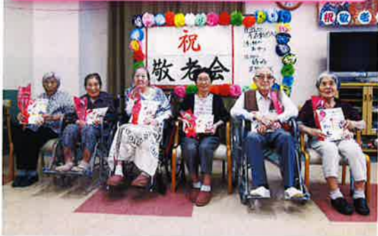
今年、デイケアさくらには30名の寿表彰者が！ 皆さんおめでとうございます！！