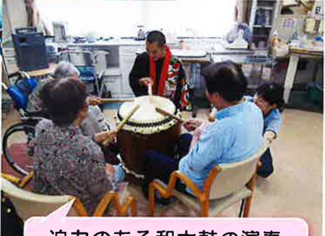
迫力のある和太鼓の演奏 に皆さん感動されていま した。太鼓に触れる貴重 な経験となりました。