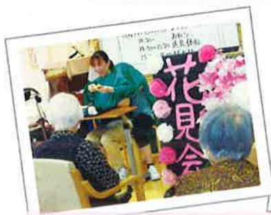
「花見会」の花飾りは、スタッフ利用者様と作成しました ♪

4月2日（金）「ケアポート花見会」を開催予定でしたが、今年も昨年同様「新型コロナウイルス感染予防」の為、縮小して「春のお楽しみ会」を実施しました。