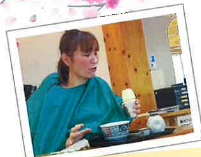
☆ スタッフ出し物の二人羽織 ☆ うどんやアイスを食べたり、お化粧品やかつら被ったり、表情と手の動きが伴わないおかしな動きに、皆さん大笑いされてました ♪